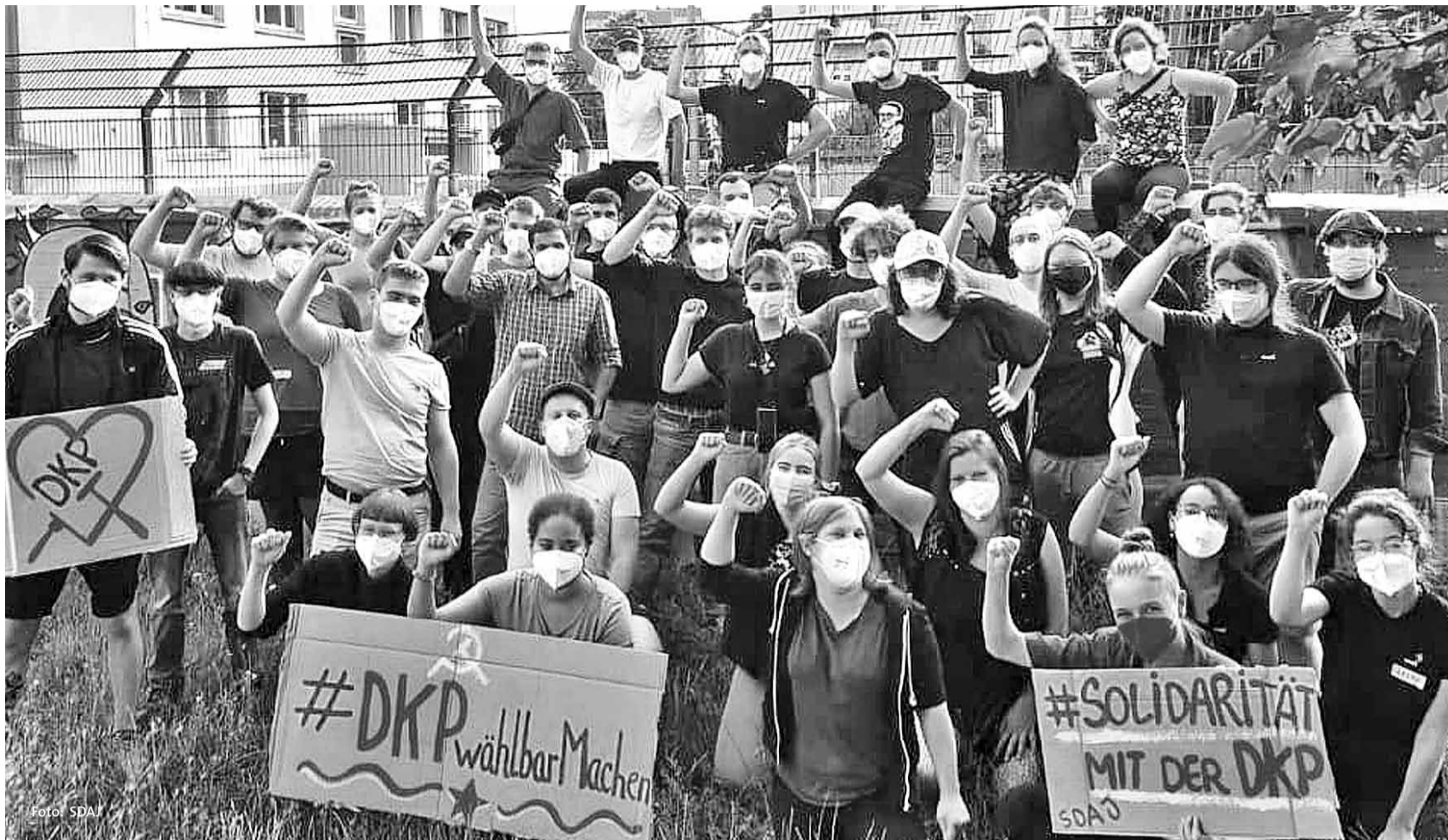
Solidaritätsaktion der Sozialistischen Deutschen Arbeiterjugend (SDAJ): #DKPwählbarMachen

Vereinigung demokratischer Juristen nimmt Rechtsauffassung des Bundeswahlleiters auseinander