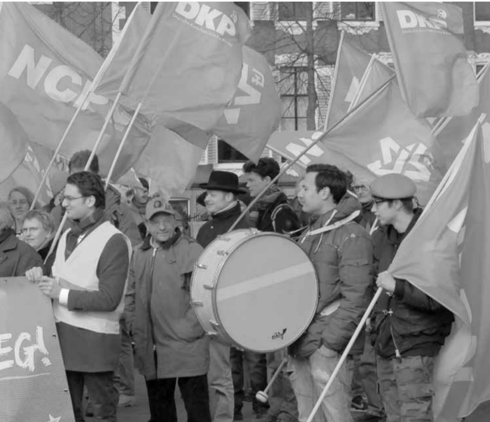
sationen aus Deutschland bekam die DKP nach der Sitzung des Bundeswahlausschusses rparteien aus der ganzen Welt. Auch bei Redaktionsschluss dieser Ausgabe der UZ trafen blog.unsere-zeit.de veröffentlichen. In dieser Ausgabe dokumentieren wir eine Auswahl.

Liebe Genossinnen und Genossen! Mit tiefer Besorgnis hat die Portugiesische Kommunistische Partei die Entscheidung des deutschen Bundeswahlleiters zur Kenntnis genommen, die Teilnahme der Deutschen Kommunistischen Partei an den am 26. September stattfindenden Parlamentswahlen nicht zuzulassen. Die PCP weist vehement jeden Versuch zurück und verurteilt ihn, der unter dem Vorwand einer Verfahrensfrage – der angeblich verspäteten Einreichung von Jahresabschlüssen – darauf abzielt, der Deutschen Kommunistischen Partei das Recht auf Teilnahme