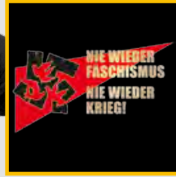
T-Shirt „Nie wieder Faschismus – Nie wieder Krieg!“ schwarz, Größen: S – 4XL